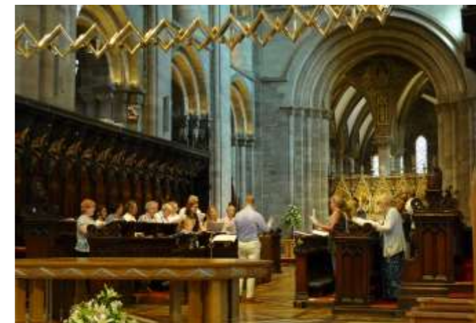
Chorprobe vor dem Evensong in der Kathedrale von Hereford.

Beginn ist jeweils um 14.30 Uhr im Gemeindehaus.